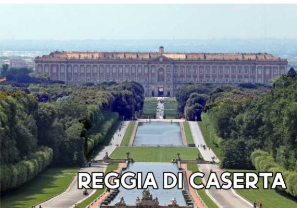
REGGIA DI CASERTA