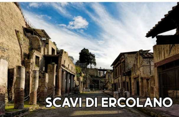
SCAVI DI ERCOLANO